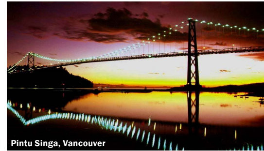
Pintu Singa, Vancouver

Berjalan masuk sebuah masjid Vancouver adalah sedikit seperti memasuki sebuah forum Persatuan Bangsa-bangsa Bersatu. Adalah biasa untuk melihat Muslim dari berpuluhan negara berbeza bersembahyang bersama, selalunya dengan menggunakan Bahasa Inggeris sebagai satu-satunya bahasa pengantar.